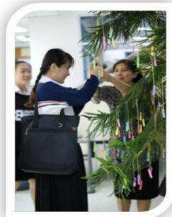
๗. ต้นไม้ให้ความรู้