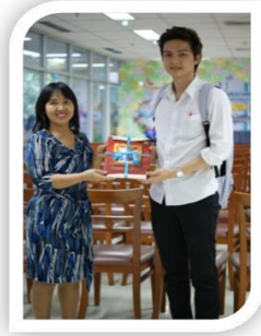
๕. กิจกรรม “Shopping Books”