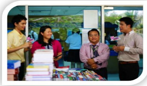
๖. Memory Shot