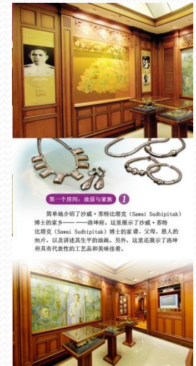
第一个展厅：故居与家人 简单介绍了萨威·苏特比塔克 (Sawai Sudhavitak) 博士的家——“精神屋”。这里展示了萨威·苏特比塔克 (Sawai Sudhavitak) 博士的家谱、父母、感人的照片，以及讲述其生平的视频。另外，这里还展示了萨威博士具有代表性的工艺品和奖杯获得者。